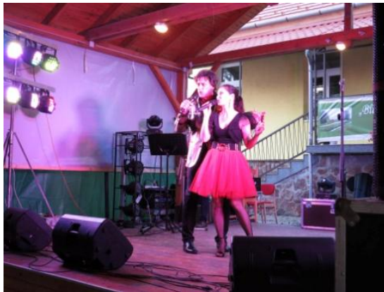
(Tihanyi Vándorszínpad fellépése)

Szintén a közép korosztálynak kívántunk kedvezni a Tihanyi Vándorszínpad új műsorával a Szenes Iván Show-val. Az est során jól ismert dalok csendültek fel, amelyek megalapozták a további jó hangulatot.