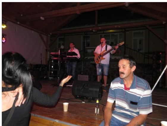
(Péntek esti bál a Turbó Együttessel)