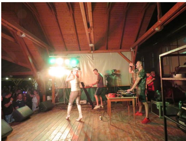
(Peat Jr. & Fernando Feat Sheela fellépése)