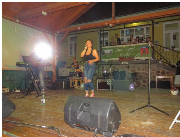
(Esti bál a Macskajak Bulizenekarral)