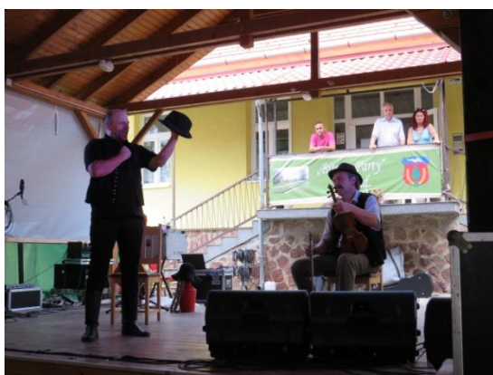
(Csavar Színház előadása)

E napi programjainkat a testvértelepülési dokumentumok aláírásához igazodva és a csiliznyáradi vendégeinket szem előtt tartva igyekeztünk összeállítani. A Déryné Programnak köszönhetően a Csavar Színház – A nagyidai cigányok című darabját tekinthették meg látogaink.