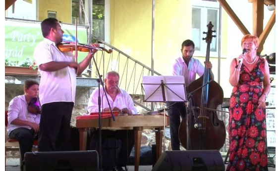
(Greznár Zenekar fellépése)